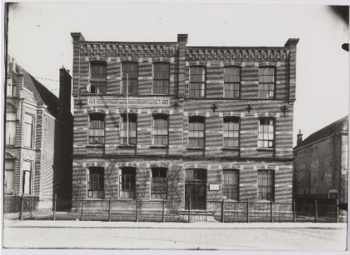
de huishoudschool voor meisjes in Alkmaar

onderscheiden. Bovendien werd zij in 1900 afgevaardigde van Nederland naar het Congres voor werken en instellingen voor vrouwen in Parijs.