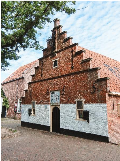
museum Het Sterkenhuis sinds 1915 in dit pand

Die verzameling vormde de basis voor de collectie die nog steeds in het museum Het Sterkenhuis te vinden is. Dat museum ontstond toen de theeplanter Sterken een geheel vervallen boerderijtje vlak bij de Ruinekerk van de sloop redde en liet ombouwen tot een museum. In 1915 was dat gereed en kon de collectie van Marie van Reenen-Völter daarnaar worden overgebracht.