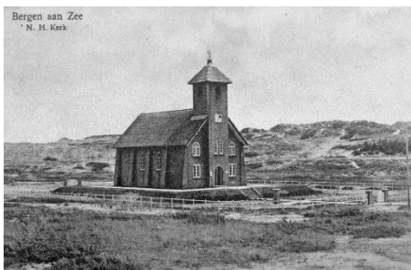
het Vredeskerkje in Bergen aan Zee

Net als in Parijs zou er een bibliotheek in komen, die tot 1922 ook als zodanig voor de vaste inwoners van Bergen aan Zee heeft gefunctioneerd.