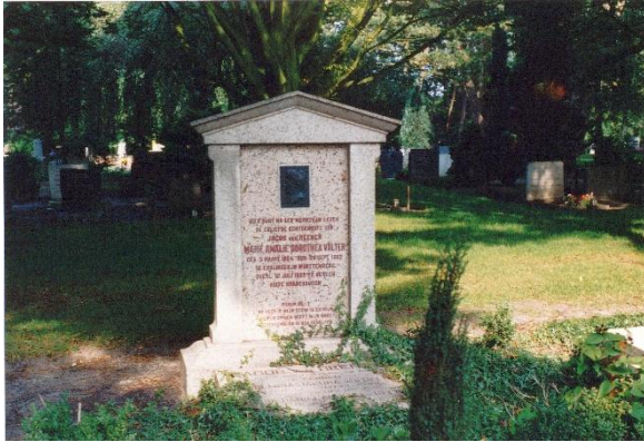
het graf op de algemene begraafplaats in Bergen